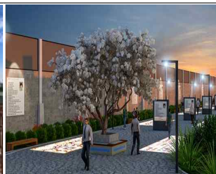
문화역사의 거리 조성(안)