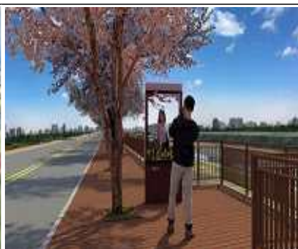
사진찍고 싶은 거리 조성(안)