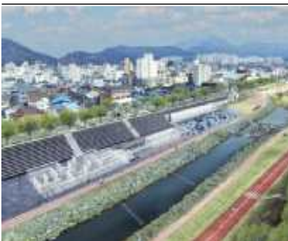
핫플레이스 물테마시설 조성(안)