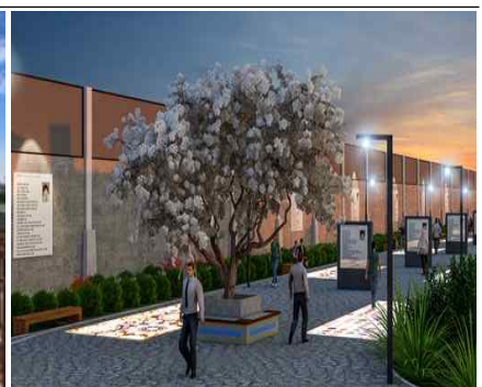
문화역사의 거리 조성(안)