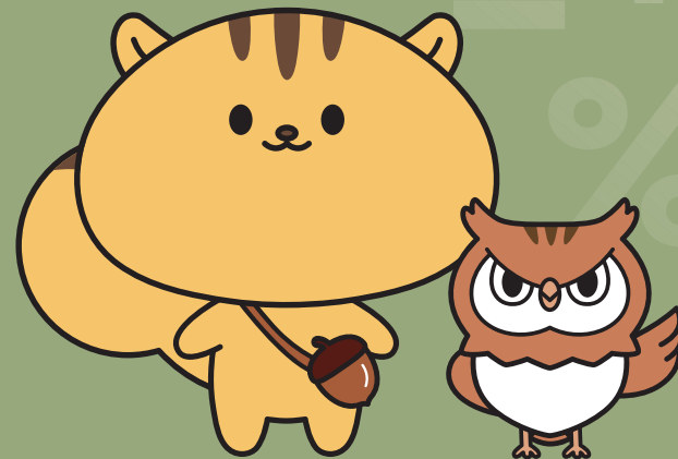
행정안전부 캐릭터 다행이·부리부리