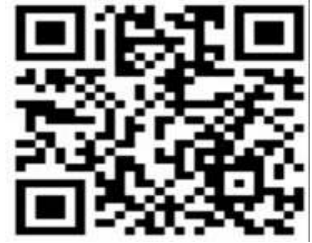
<네이버 폼 QR>