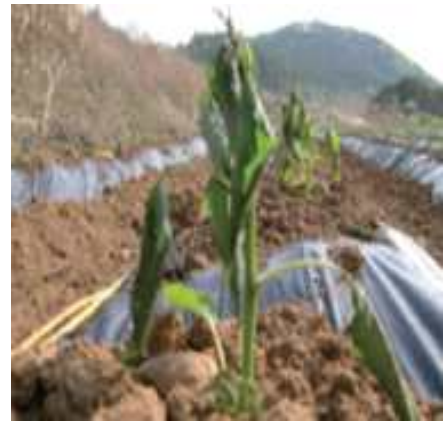
< 고추 저온 및 동해에 의한 피해 >