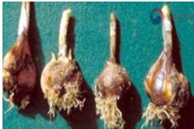
< 뿌리응애 피해 증상 >