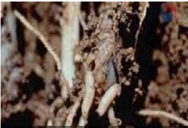
< 고자리파리 피해 증상 >