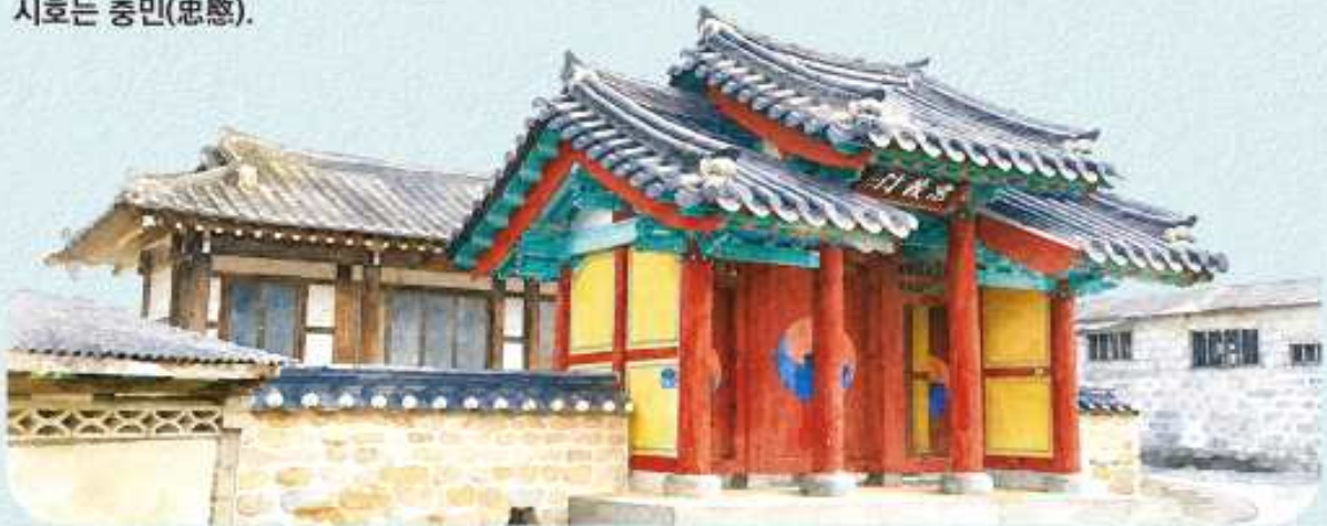
〈백광언이 배향된 정읍시 응동면의 모충사〉