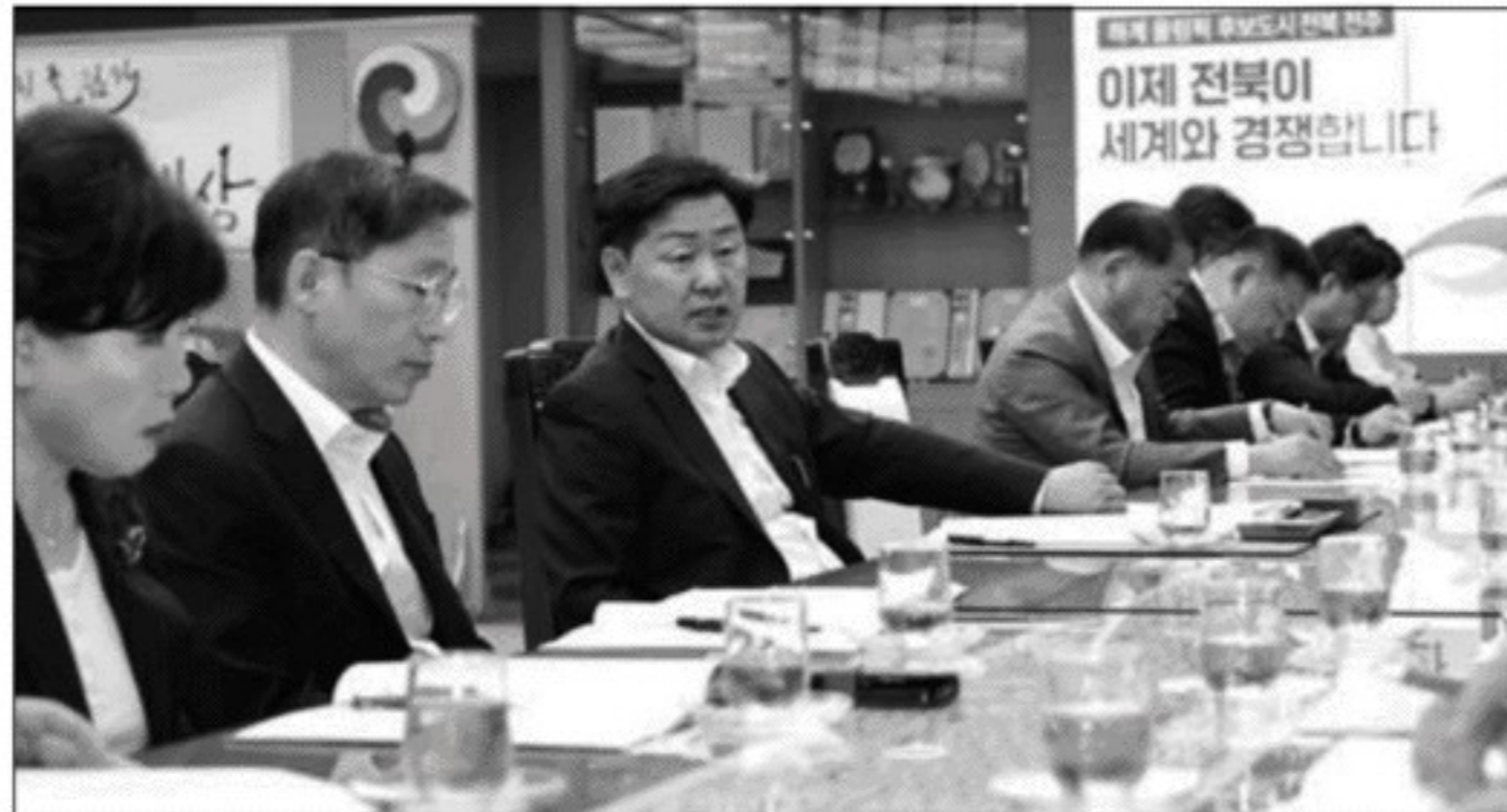
김관영 전북특별자치도지사가 15일 간부회의를 주재하고 민선 8기 핵심 도정 현안의 성공적 마무리 방안과 새만큼 기본계획(MP) 재수립 대응, 지출 구조조정 등 도정 전반을 집중 점검했다.

김관영 전북특별자치도지사가 15일 간부회의를 주재하고 민선 8기 핵심 도정 현안의 성공적 마무리 방안과 새 만큼 기본계획(MP) 재수립 대응, 지출 구조조정 등 도정 전반을 집중 점검했다.