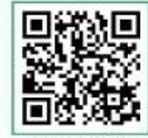
TV기능 설명 영상