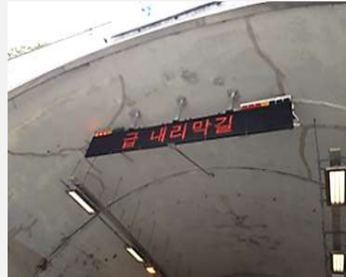
터널 전광판 위 경광등