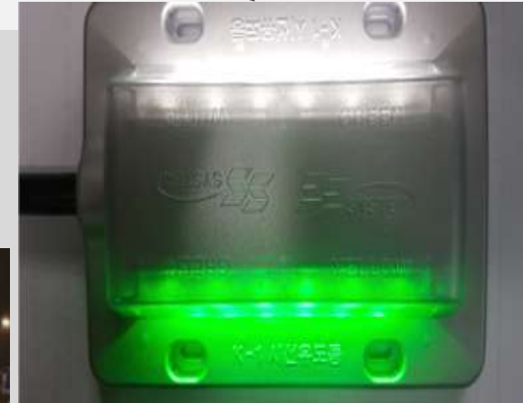
LED시선유도등 (KTR 인증)