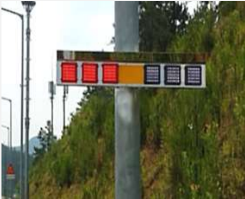
갓길 설치(가로등 충전식)