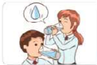
1 물을 자주 섭취해 마신다.