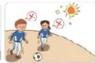
3 단아 시기에 운동에 참여한다(따뜻한 등 심의활동을 가배한다.)