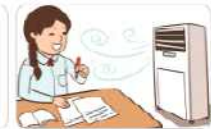
2 시원하게 자란다.